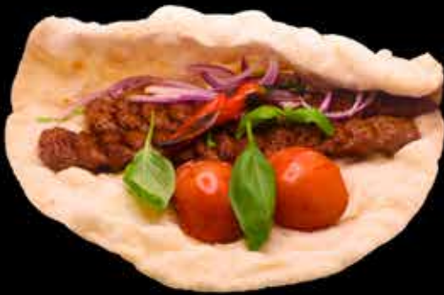
ADANA KEBAB €16

n.320 g marinoituja suussa sulavia kanan rintafilevartaita