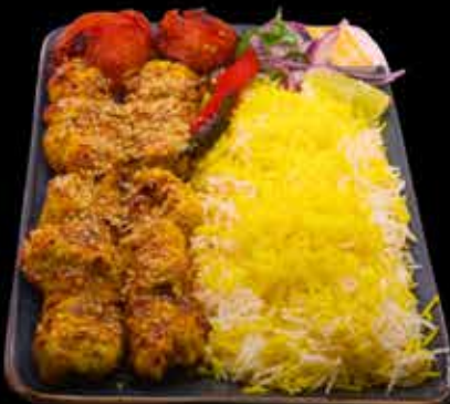
JUJE TORSHKEBAB €19,90

200 g lampaanliha bārbāri leipä tomatti sipuli