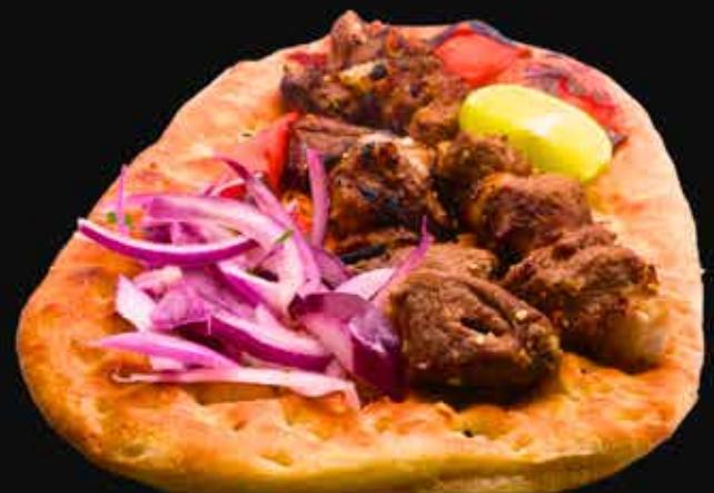
CHUPAN KEBAB €24

160 g naudan sisäfilevartaita , 200 g naudan & lampaan jauhelihavarras ja basmati-sahramiriisin kanssa.