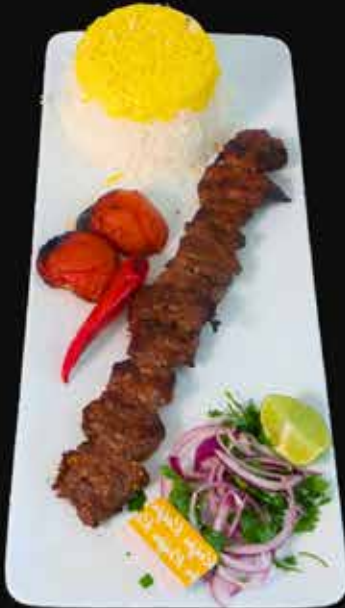
CHENJE KEBAB €20

230 g naudan sisä file basmati sahrami riisi