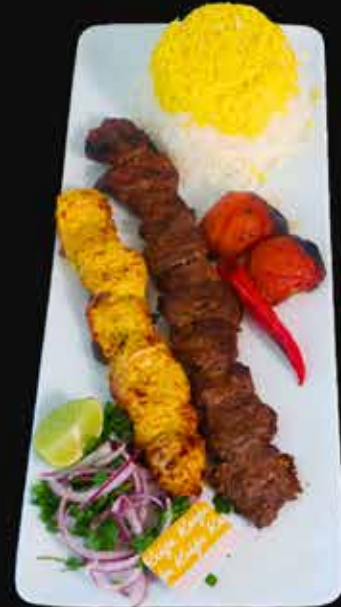
BAKHTIARI JUJE €29

230 g naudan sisä file basmati sahrami riisi