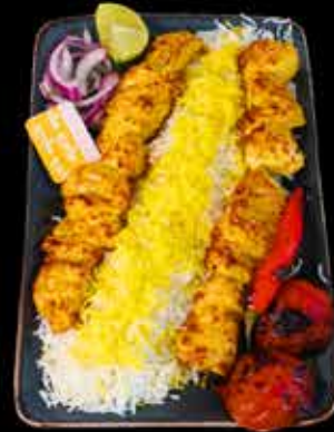
JOOJEH KEBAB €17,90

n.320 g marinoituja suussa sulavia kanan rintafilevartaita