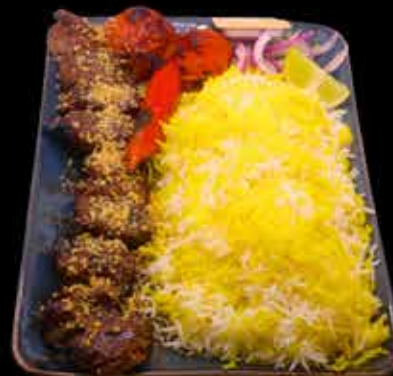
CHENJE TORSH €22,90

320 g kana rintafile vartaita sitten marinoituja suussa sulavia ja Granaattiomenatahna ja pähkinä (paistinvarrasta )