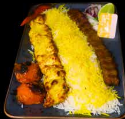
MIX KEBAB €18,90

320 g naudan & lampaan jauhelihavarras, chilipaprika persil ja, valkosipuli